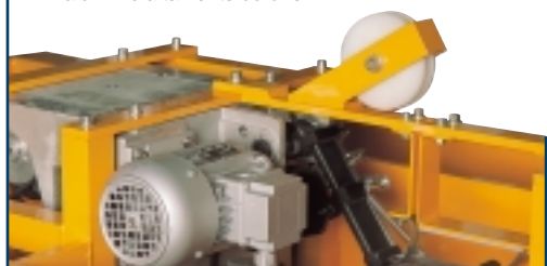
Cabeça de cintagem de alumínio altamente durável.