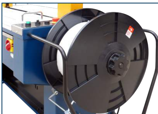
Bobine situada à altura da cinta e com sistema de troca rápida.