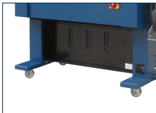
Equipada com rodas para facilitar a movimentação.