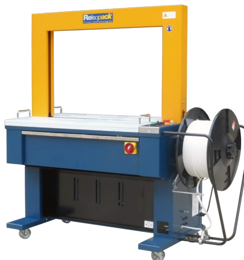
Cintadora com sistema automático de alimentação e ejector automático de cinta.